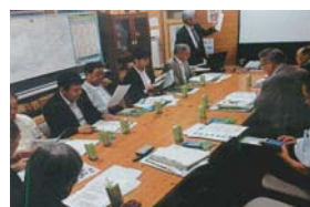
2017. 6. 29 一真会 ウッドピア視察