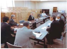
2017. 5. 24 一真会 郡山場外車券売場視察