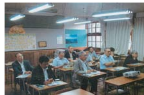
2017. 6. 30 一真会 秋津野ガルテン視察