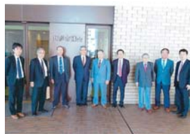
2017. 4. 27 一真会 山形市役所視察