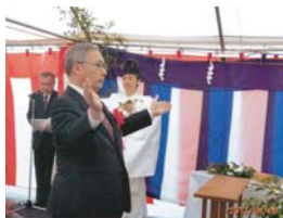
2017. 4. 9 中藤公民館竣工式