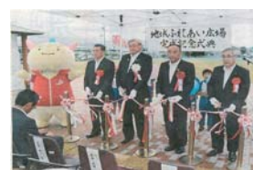
2017. 6. 2 福井市中央卸売市場 ふれあい広場完成式典