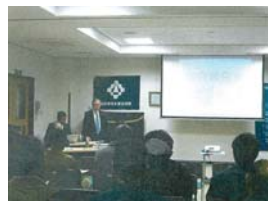
2017. 4. 5(宝永) 4. 7(清水東) 4. 13(春山) 議会報告会