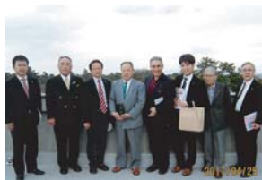
2017. 4. 25 一真会 弘前市役所視察