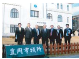
2017. 11. 17 一真会 豊岡市役所視察