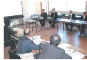
2017. 11. 16 一真会 境港市役所視察

広域的集荷力・安定的供給力を持つ。農水省の言う「自主的に再編に取り組むべき市場」には当たらない。また、改訂版のメダマとしては、7基本目標と33の取組みがある。「花き部門の運用形態の変更」、「コールドチェーン導入」もその一部。卸売市場法が改正される見込みに合わせて、前寄せで新しいプラン改訂を行う。