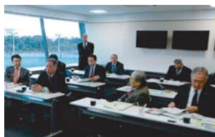
2018. 2. 6 一真会 別府競輪場視察