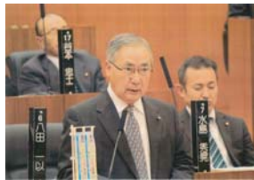
2017. 12. 4 一般質問