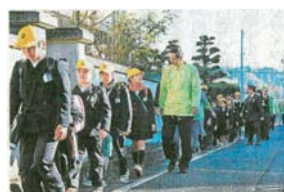
2017. 11. 6 東藤島地区子供重点 見守りデー