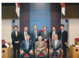
2017. 11. 15 一真会 雲南市役所視察

国保を将来にわたって堅持できるよう、県とともに健全な運営に努める。糖尿病予防等のため特定検診の受診率向上に力を入れるなど、医療費の抑制に努め、事業運営の改善に努力する。保険者努力支援制度で多くの支援が国から得られるよう努力するとともに、国に支援の拡充を要望することを考えたい。