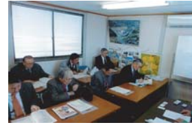
2018. 2. 7 一真会 道の駅豊前おこし かけ視察