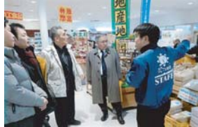
2018. 2. 8 一真会 重点道の駅ソレーネ 周南視察