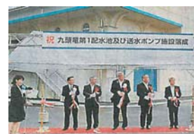
2017. 10. 4 九頭竜浄水場 ポンプ施設落成式