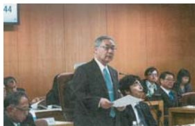
2018. 3. 15~16 予算特別委員会

消雪道路にするには水量確保のためのボーリング調査が要る。現状の消雪化計画に則って対応していく。